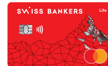
Swiss Bankers Life Prepaidkarte