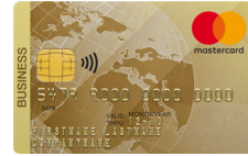
Mastercard® Business Gold in CHF/EUR/USD