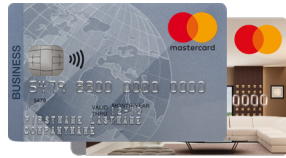
Mastercard® Business Silber in CHF