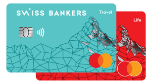
Swiss Bankers Travel/Life